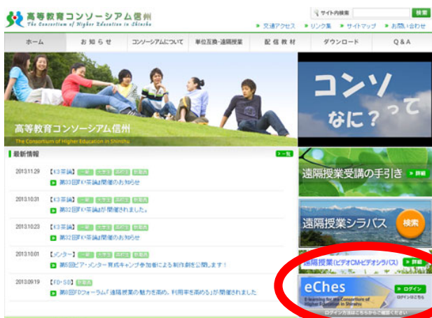
▲①「高等教育コンソーシアム信州」公式Webサイトトップページ

eChes (E-learning for the Consortium of Higher Education in Shinshu) は、「高等教育コンソーシアム信州」専用のLMS (Learning Management System: 学習管理システム) です。 eChesでは、インターネットを介した講義資料の取得、課題レポートの提出、受講生同士の意見交換や講師への質疑応答などを行うことができます。