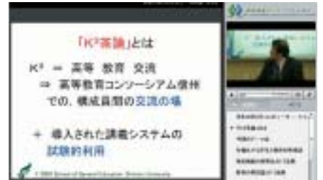
「K 3 茶論」講演コンテンツ