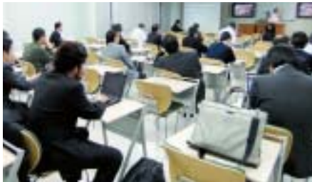
「K 3 茶論」受講者の様子

平成21年度には全12回が開催され、県内の各大学がさまざまなテーマで茶論を配信しました。過去の「K 3 茶論」の講演の様子は、講演コンテンツとなっており、「高等教育コンソーシアム信州」ホームページでいつでもご覧いただくことが可能です。