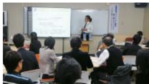
FDフォーラムの様子

また、SD研修会を県内8大学へ遠隔配信するなど、県内大学教職員の教育力向上に努めています。