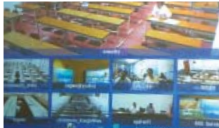
「K 3 茶論」の様子を各大学へ遠隔配信