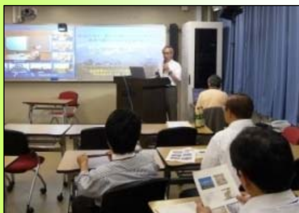
自大学で他大学の講義を受講