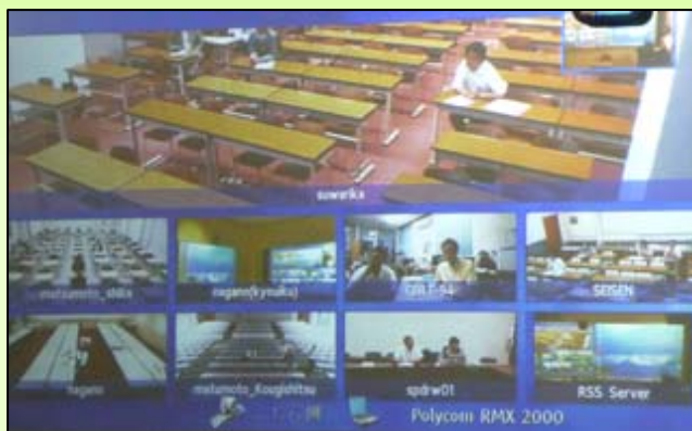
8大学を結ぶ遠隔講義システムの映像

毎回異なる講師の方をお招きし、遠隔講義システムを活用して、自由なテーマのもと参加者同士で楽しくトークをする、という気軽なスタイルの「茶論（サロン）」です。聴講者としてはもちろん、講師としても、どなたでも無料でご参加いただくことができます。ぜひ一度足をお運びください！