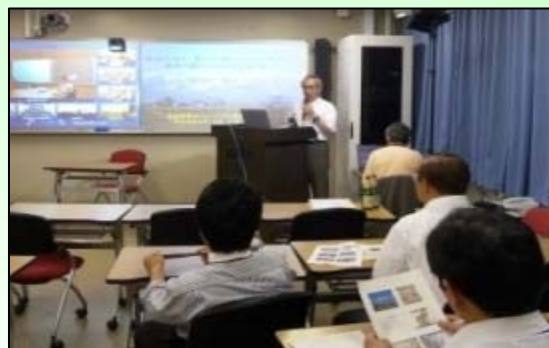
自大学で他大学の講義を受講