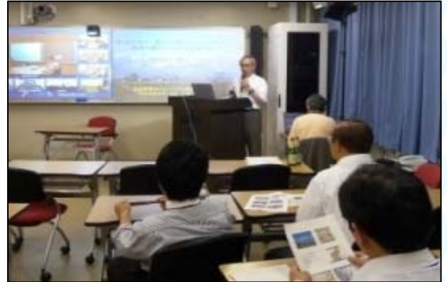
自大学で他大学の講義を受講