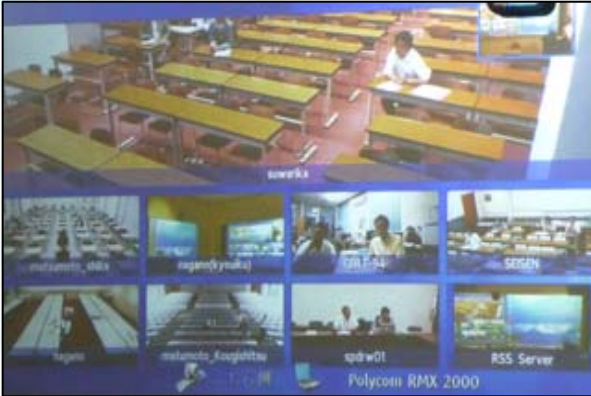
8大学を結ぶ遠隔講義システムの映像

聴講者としてはもちろん、講師としても、どなたでも無料でご参加いただくことができます。ぜひ一度足をお運びください！！