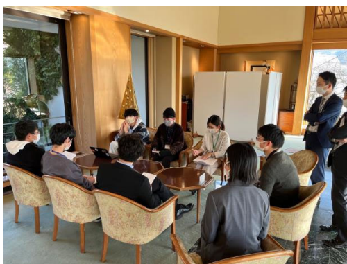
松本若者会議2021の様子

今年度も「大しごと〜 in 信州 Advance 2022 若者会議 (Youth District)」を開催します。今年度は4つのテーマを設定して、長野県内の各地域で定期的な戦略会議を企画します。この中で、学生から社会人までの青年が一緒になってテーマに関わる課題と要因を考え、自分たちで課題に取り組みます。地域のことを知り、交流やアクションを深めることができる貴重な機会です。