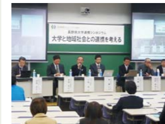
▲シンポジウムの様子

当コンソーシアムでは、より一層の地域連携を深めようと、加盟大学・県と連携してシンポジウムを開催しています。県外・県内大学教職員や県・市町村関係者、地域住民の皆さまにもご参加いただき、地域と連携した様々な取り組みに一層弾みがつくものとなっています。