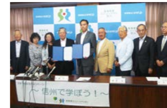
▲共同記者会見の様子

当コンソーシアムでは、長野県の学生募集に関する情報発信を強化し、信州で学ぶ魅力をアピールしようと、県と連携し「信州で学ぼう! 大学発信事業」を展開しています。