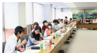
▲大学祭実行委員会交流会の様子

大学祭実行委員会交流会は、各大学の大学祭の期間だけではなく、一年を通じて様々な企画を立てて大学間の交流をすすめています。企画のひとつとして、長野県学生生活動PRキャラクター「ナー」を作製しました。イベント等に無料で貸し出され、イベントを盛り上げます。