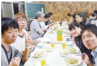
▲参加者全員で食事

加盟大学学生を対象としたキャンプは、大学間の枠を超えた交流ができ、毎年好評のイベントのひとつです。本キャンプは、授業により積極的に参加できるよう、学生がグループ学習で教員をサポートし、学生の推進役を務める「学生ピア・メンター」を育成することを目的としており、心の成長が体感できるプログラムを組んでいます。