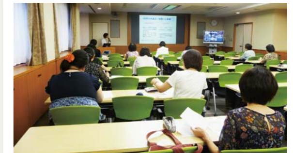
▲ネットワーク配信の様子

これまでに開催したセミナーは、ビデオコンテンツになっており公式ホームページからご覧いただけます。