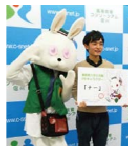
▲PRキャラクター「ナー」

大学祭実行委員会交流会は、各大学の大学祭の期間だけではなく、一年を通じて様々な企画を立てて大学間の交流をすすめています。企画のひとつとして、長野県学生生活動PRキャラクター「ナー」を作製しました。イベント等に無料で貸し出され、イベントを盛り上げます。