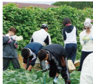
▲キャベツの収穫体験の様子

加盟大学学生を対象としたキャンプは、大学間の枠を超えた交流ができ、毎年好評のイベントのひとつです。本キャンプは、授業により積極的に参加できるよう、学生がグループ学習で教員をサポートし、学生の推進役を務める「学生ピア・メンター」を育成することを目的としており、心の成長が体感できるプログラムを組んでいます。