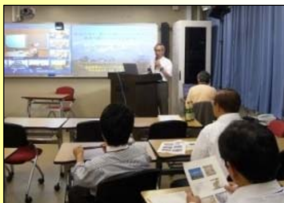
自大学で他大学の講義を受講