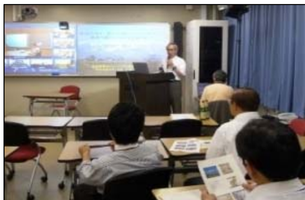
自大学で他大学の講義を受講