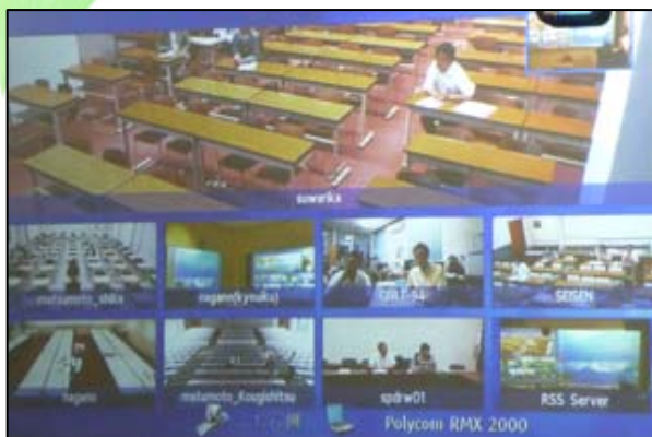
8大学を結ぶ遠隔講義システムの映像

聴講者としてはもちろん、講師としても、どなたでも無料でご参加いただくことができます。ぜひ一度足をお運びください！！