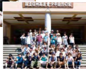
各大学からの参加者