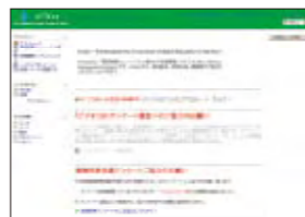
高等教育コンソーシアム信州のLMS TeChes (イーチェス)