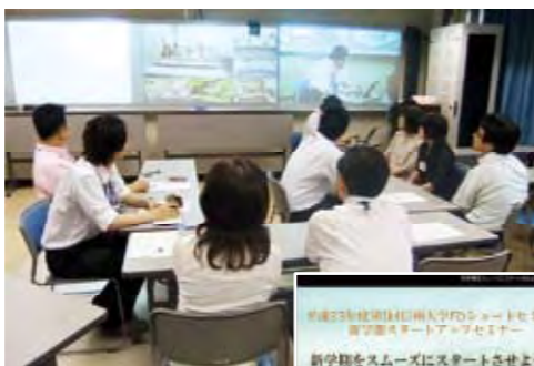
K³茶論のネットワーク配信の様子

また、リメディアル教育としても人気の高い「英語基礎I、II(たてなおしの英語)」は、一般向けにゲスト開講されており、どなたでもコンソーシアムのホームページからe-Learningで受講することが可能です。