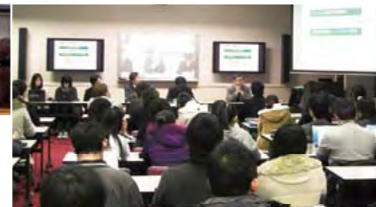
インターンシップ成果発表会