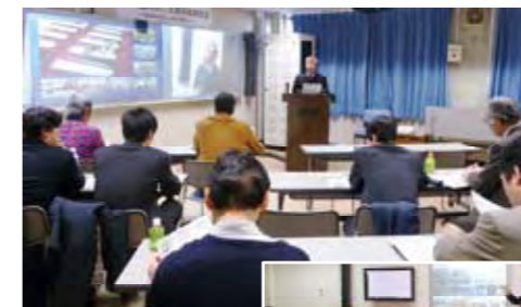
FDフォーラムの様子

また、県内大学間の学生間交流事業を支援するなど、コンソーシアムの学生支援事業は多岐にわたります。