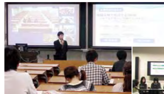
業種・業界研究会の様子

学生がより積極的に授業に参加できるよう、グループ学習で教員をサポートし、学生の推進役を務める「学生ピア・メンター」を育成するキャンプを、毎年1泊2日の日程で開催しています。県内各大学から教員と学生が参加し、さまざまなグループワークや講演を通して、ファシリテーションやコミュニケーションについて考え、実践しています。